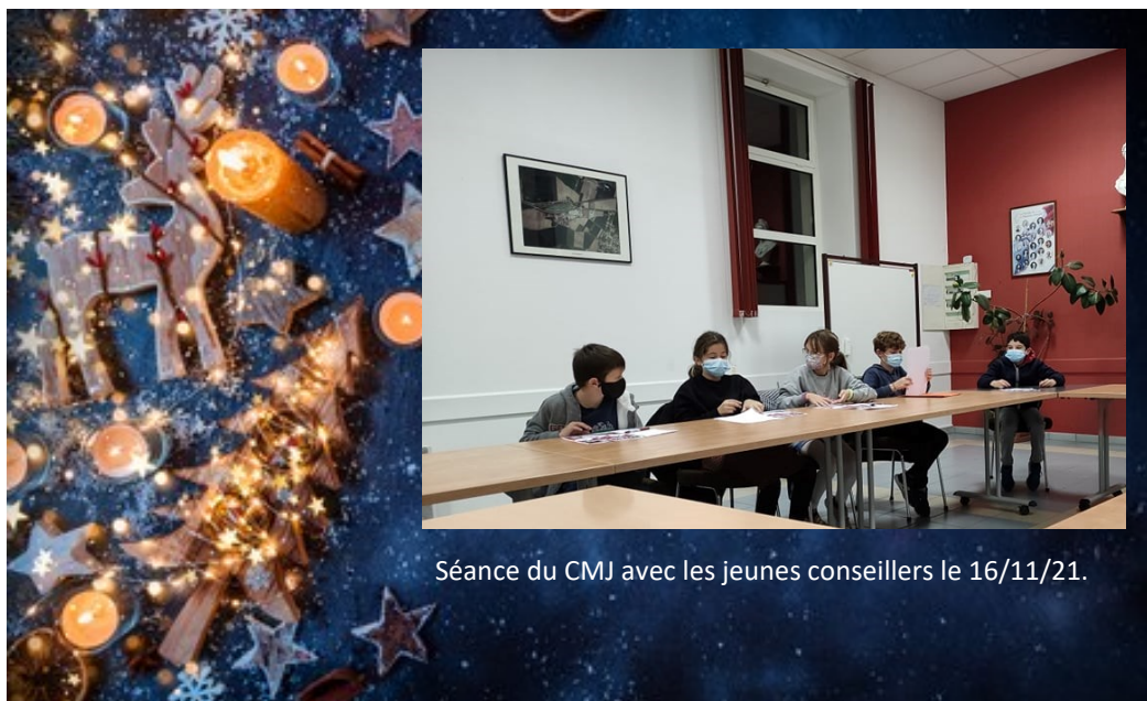
Séance du CMJ avec les jeunes conseillers le 16/11/21.